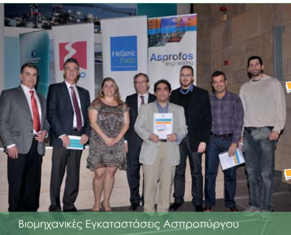
Βιομηχανικές Εγκαταστάσεις Ασπροπύργου

Στο πλαίσιο Αναγνώρισης και Επιβράβευσης της εξαιρετικής απόδοσης των εργαζομένων με βάση τις αρχές του Ομίλου για δεύτερη συνεχόμενη χρονιά τιμήθηκαν όσοι ξεχώρισαν στη διάρκεια του 2012 σε ατομικό ή ομαδικό επίπεδο.